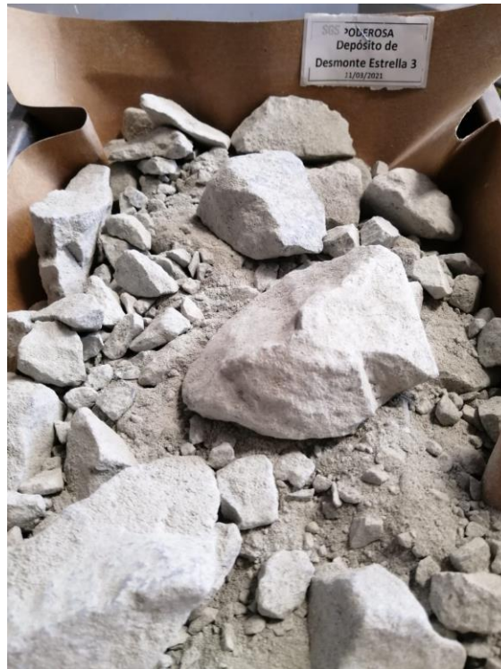
Figura 1: Aspecto físico de la muestra recepcionada

This document is issued by the Company under its General Conditions of Service accessible at http://www.sgs.com/en/Terms-and-Conditions.aspx . Attention is drawn to the limitation of liability, indemnification and jurisdiction issues defined therein.